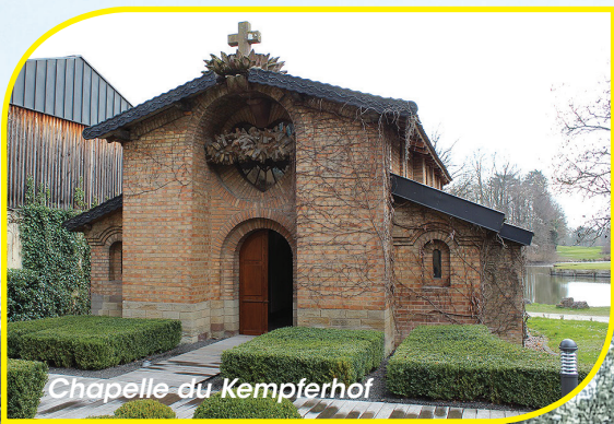
Chapelle au Kempferhof