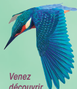
Venez découvrir le martin-pêcheur

c'est au point de départ qu'ils vous déposeront. Les curieux pourront découvrir, en face du débarcadère, un regroupement exceptionnel de bornes de Tulla , système ingénieux qui permettait de définir l'emplacement des limites des communes frontalières.