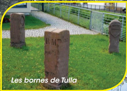
Les bornes de Tulla